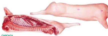
CARCAÇA PORK SIDE - CARCASS