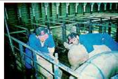
Momento de la detección del celo en la cerda por el hombre sin la ayuda del macho

También para el control del celo en aquellas unidades donde no existen machos testificadores Polge (1989) recomienda el uso de los odoríferos sexuales, estos odoríferos fueron aislados primeramente en la región prepucial del verraco, actualmente se obtiene de las glándulas salivares, estos son utilizados en forma de spray en los cuarterones de las hembras próximas al celo, favoreciendo así la vigilancia y control del celo en las cerdas.