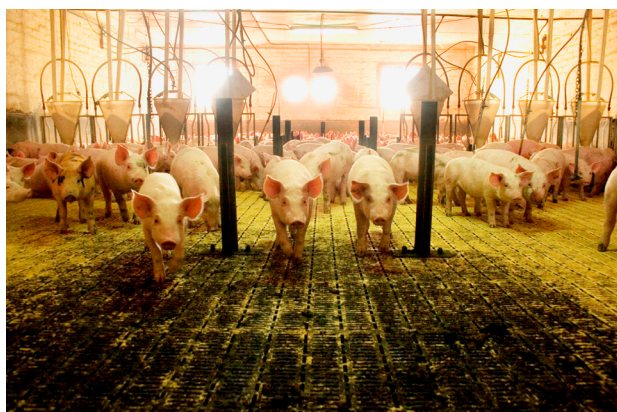
Producción confinada en galpones. Las instalaciones deben mantenerse limpias y con la densidad adecuada de animales.