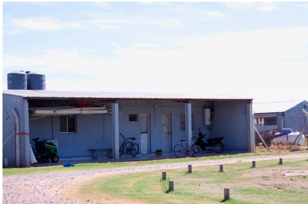
Los vestuarios son un paso obligado para el acceso de las personas a los sectores donde están los animales.

(anillos, ropa interior, celulares, etcétera). Para el resto de los establecimientos es primordial el cambio de ropa y calzado, ya que esto se puede cumplir en cualquier tipo de sistema.