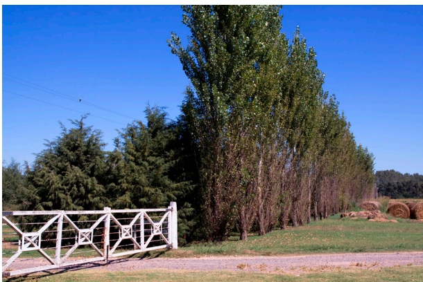
La plantación de árboles alineados forma una barrera vegetal para disminuir el efecto del viento y el transporte de agentes patógenos.

sea su tipo, deberá prevenir la entrada de animales silvestres. El uso de una cortina de árboles o cerco verde protege contra infecciones aerógenas provenientes de animales en tránsito.