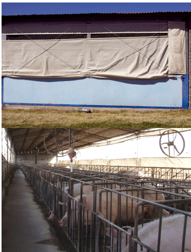
Galpones con mallas y cortinas intactas para evitar ingreso de aves y alimañas.

El control de los roedores se basa en cuatro pilares: impedir la entrada a las instalaciones y edificios, ajustar las normas de manejo de la alimentación animal para evitar, entre otros aspectos, las pérdidas de alimento que implican proliferación de roedores, prevenir que haya sitios donde puedan vivir y aplicar tratamientos estratégicos para reducir las poblaciones de roedores.