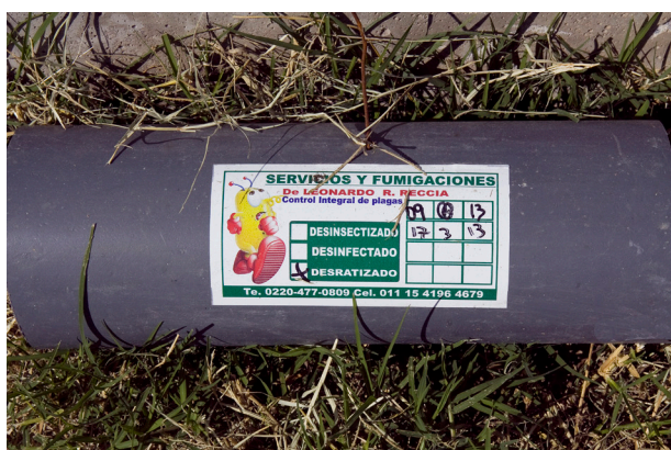
Trampa de roedores colocada en los alrededores de los galpones.

Además, no se deben utilizar alimentos importados porque algunas bacterias y virus pueden sobrevivir al procesamiento y se sabe que han sido fuente de infecciones en países distantes de su lugar de origen. El almacenamiento del mismo debe hacerse en zonas adecuadas y sin posibilidad de contacto con animales, manteniendo el lugar limpio y acopiado adecuadamente.