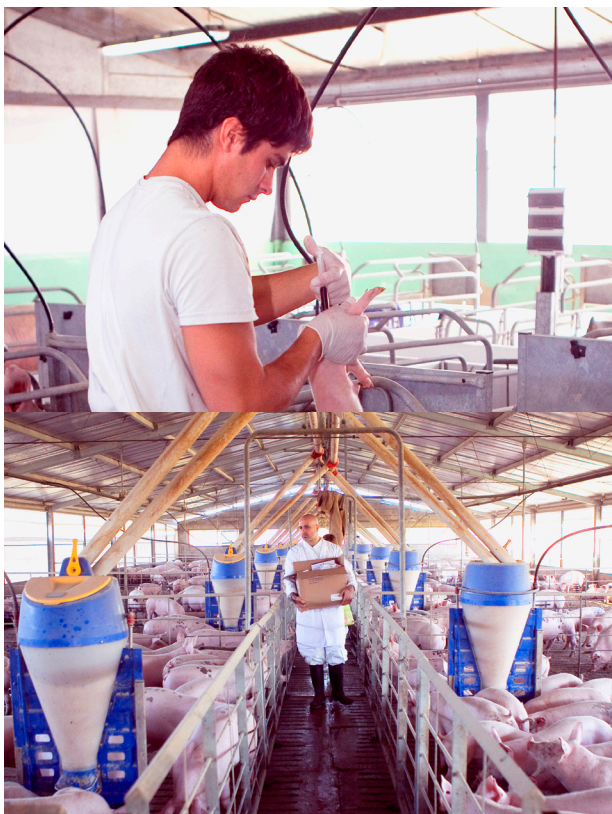
El personal de la granja debe trabajar con ropa adecuada y de uso exclusivo.

Las normas de bioseguridad planteadas también deberán ser cumplidas por todo el personal de la empresa (dueño, gerente, responsable sanitario) y por los visitantes (asesores técnicos, asesores comerciales, personal de mantenimiento contratado).