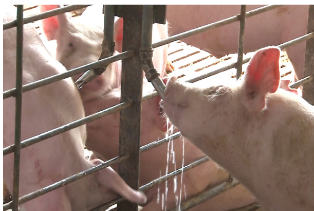
Bebedores tipo chupete. Evitan el desperdicio de agua.