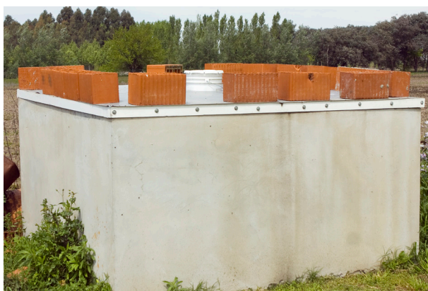
Sistema de fosa cerrada.

Debe considerarse la implementación de tratamiento de efluentes, desde separadores de sólidos hasta biodigestores, pasando por las lagunas y el compostaje. Este último tratamiento es recomendable para el manejo de cadáveres.