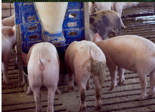
Sistema automatizado de alimentación de cerdos en confinamiento.