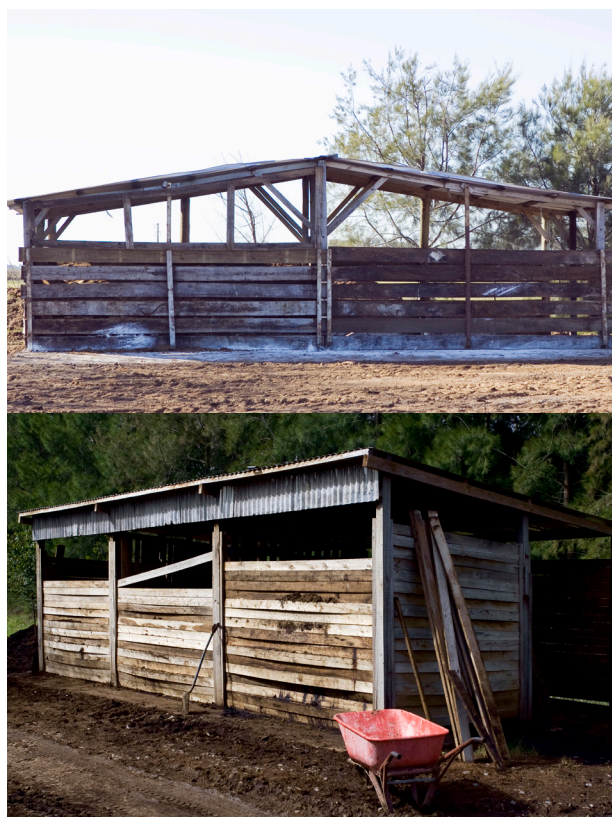
Diferentes sistemas para el compostaje.

Se debe tener en cuenta que existen diferentes leyes y reglamentos que protegen a las palomas, con lo cual es necesaria la utilización de productos no tóxicos, para eso se sugiere revisar la legislación de cada provincia.