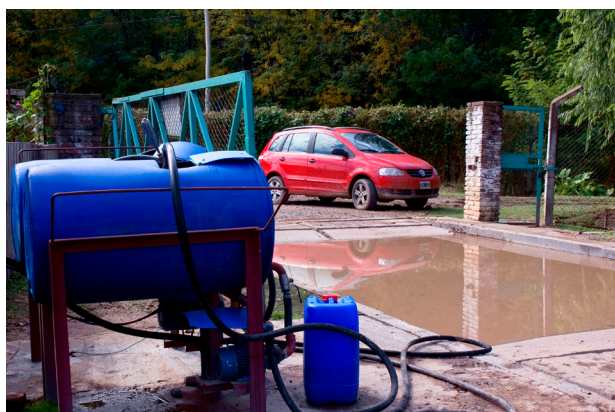
Equipos de desinfección de vehículos. En explotaciones más pequeñas puede ser reemplazado por una mochila de desinfección.

Cuando se selecciona un desinfectante, se deben tener en cuenta los siguientes aspectos: tipo de superficie a desinfectar, destino de uso (rodoluvios, pediluvios, pulverización de superficies), temperatura y tipo de superficies, dureza del agua, eficacia sobre enfermedades específicas, tiempo de contacto, toxicidad en humanos y animales, cantidad de materia orgánica presente y costos. Es importante leer atentamente el rótulo y respetar la forma de uso y las concentraciones que recomienda el fabricante. Prácticamente todos los desinfectantes son corrosivos o irritantes, por lo que el operario debe protegerse utilizando gafas y guantes, y leyendo cuidadosamente las instrucciones de uso para evitar potenciales riesgos.