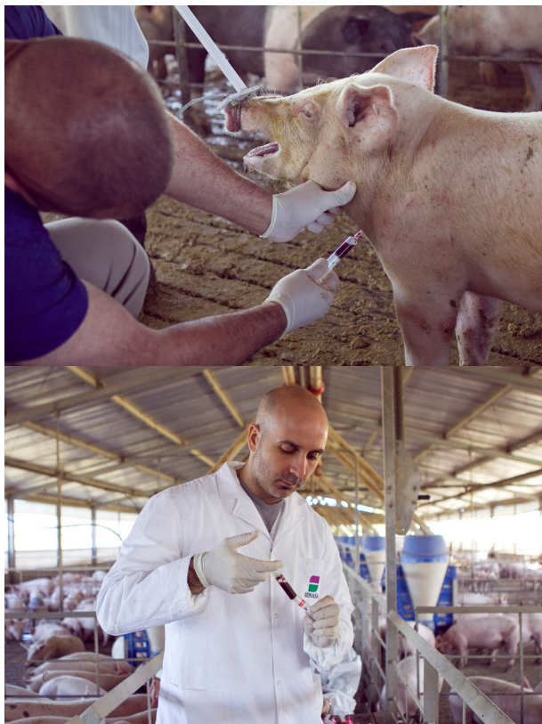
La toma de muestras permite el seguimiento del estado sanitario de los animales.

Independientemente del sistema de producción, el flujo de movimientos (animales, personas, insumos) debería ser unidireccional, esto quiere decir que se deben planificar las instalaciones para que durante el trabajo diario se pueda recorrer la granja desde los animales de menor edad hacia los de mayor edad: 1º, maternidad; 2º, destete; 3º, desarrollo/engorde.