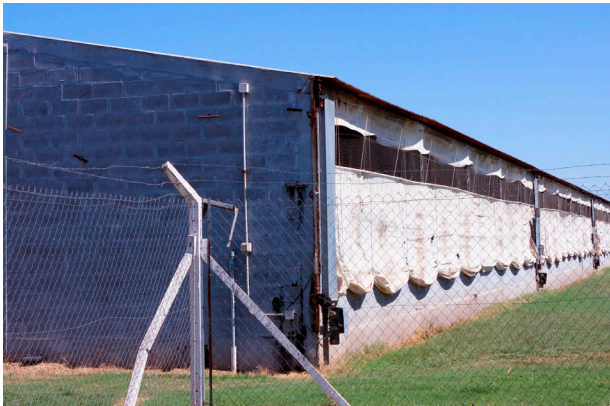
Los galpones deben estar separados del resto del establecimiento por un cerco perimetral interno.

El predio debe poseer cercas que delimiten el perímetro de la granja o, al menos, el área limpia que aloja a los cerdos del área sucia con alto riesgo de contaminación. La cerca, cualquiera