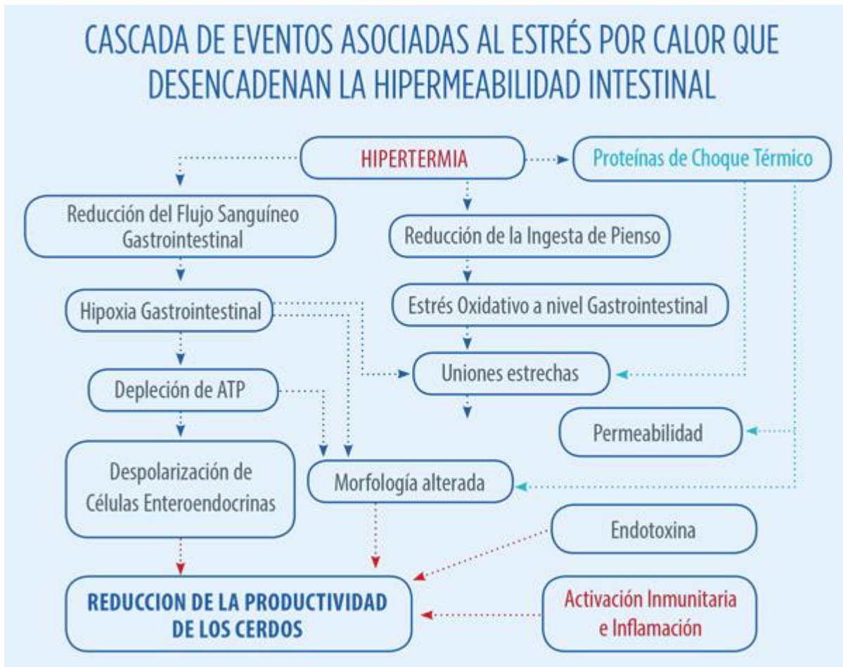
Figura 1. Efecto del estrés por calor sobre la permeabilidad intestinal.

Adaptado de Baumgard et al. 2012. Impact of climate change on livestock production . Pag. 413-468. Cap. 15. Environmental Stress and Amelioration in Livestock Production . Eds. V. Seijan et al., Springer-Verlag Berlin Heidelberg.