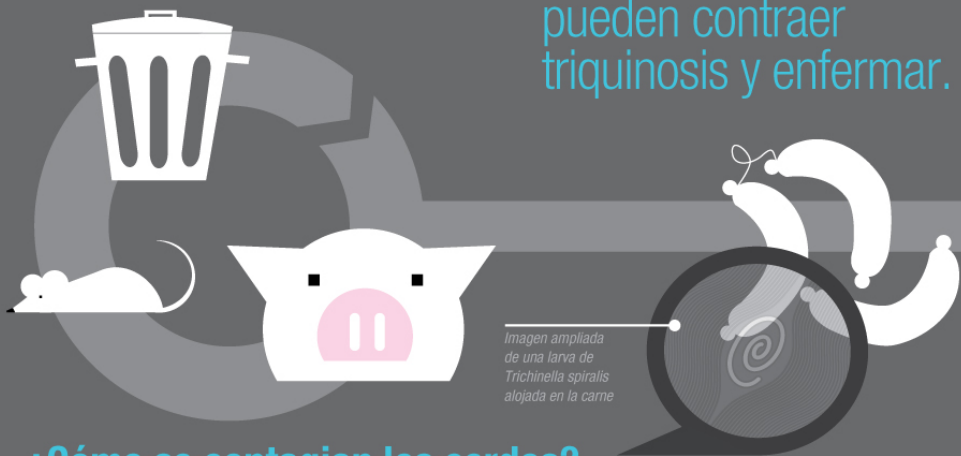
Imagen ampliada de una larva de Trichinella spiralis alojada en la carne

» Las personas también pueden contraer triquinosis y enfermarse.